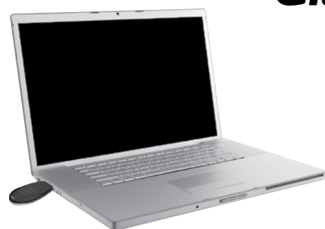
Softwareprogrammierung Programmation du logiciel