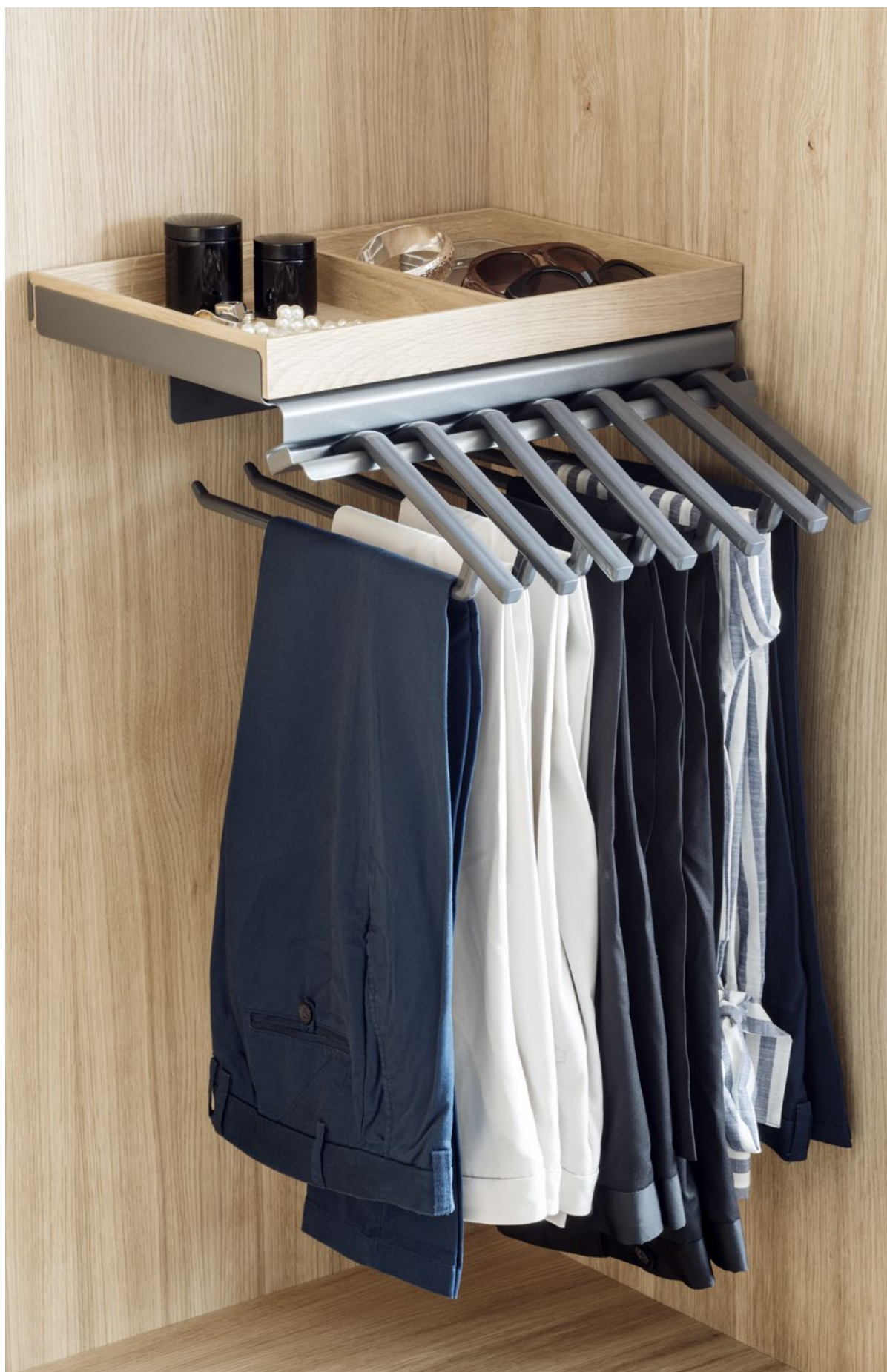
Porte-pantalons Lina et boîte en bois : Le nouveau support pour ranger vos pantalons sans plis.