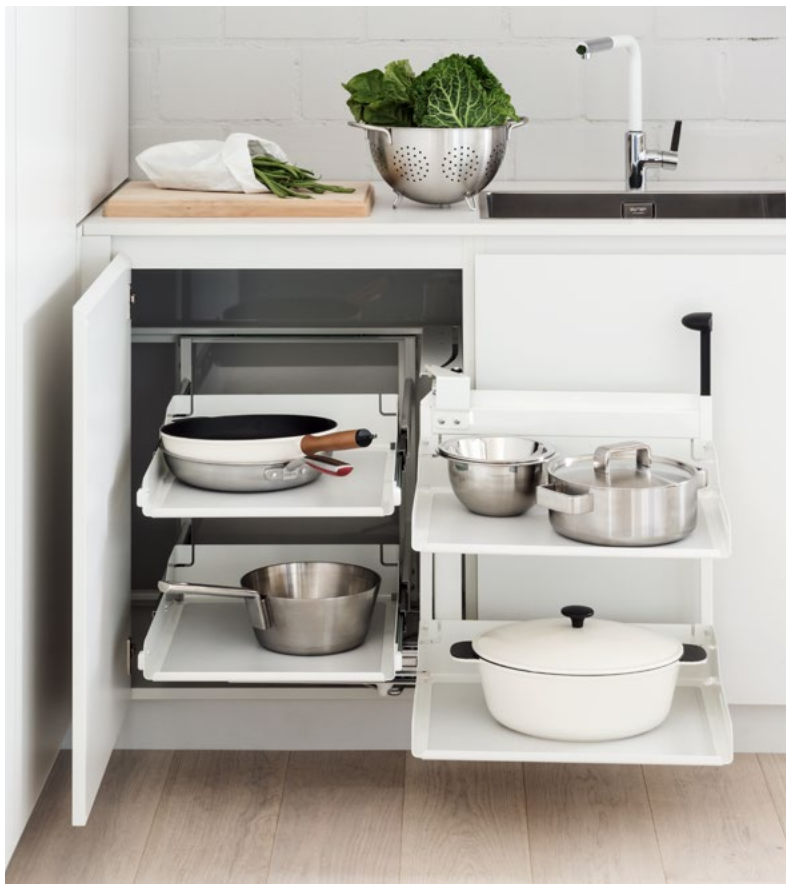
Système coulissant d'angle Magic Corner Comfort : Il suffit d'ouvrir la porte et de tirer sur la poignée pour que les étagères avant sortent entièrement du meuble en pivotant.