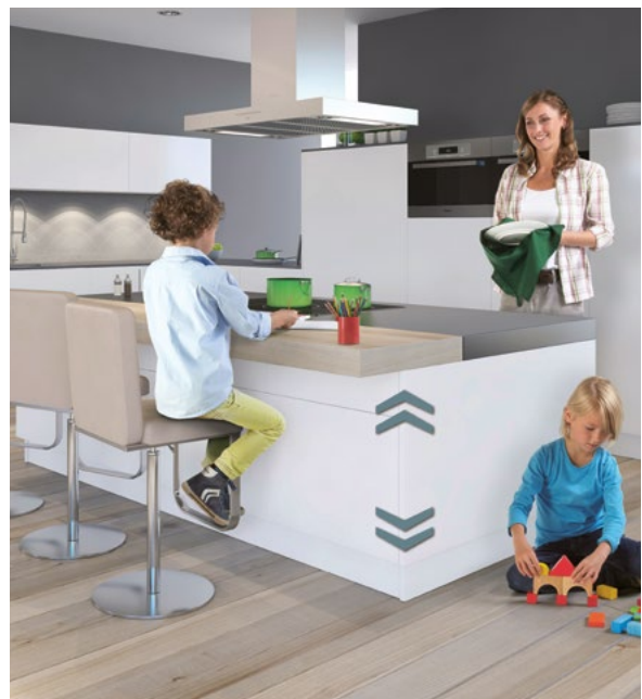
ergoAgent Base : L'îlot de cuisine réglable en hauteur en continu à l'aide d'un panneau de commande.