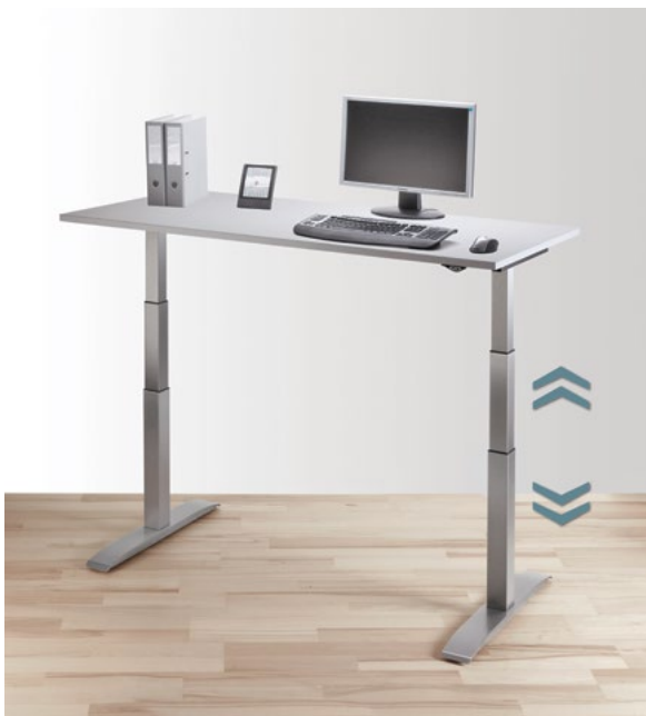
TopMotion : Le pied de table électrique réglable en hauteur.