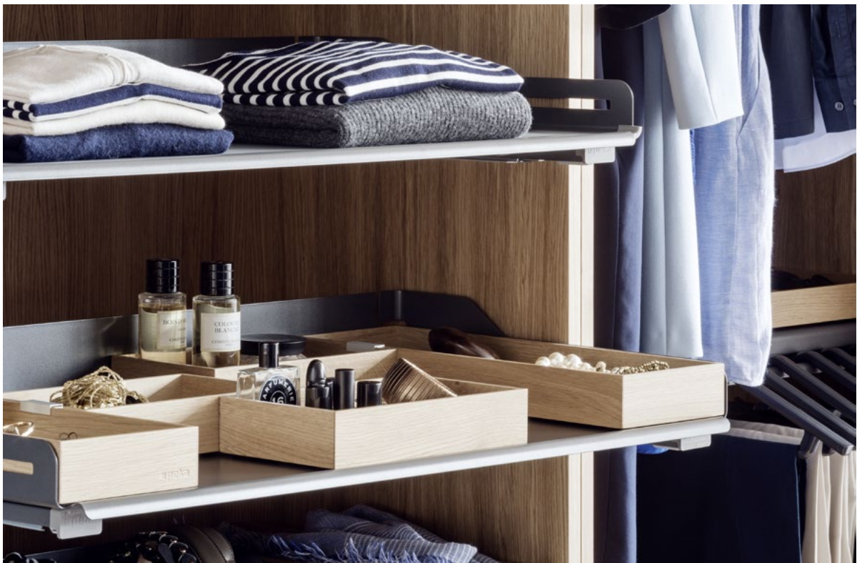
Tablette coulissante Extendo et boîtes en bois : La tablette coulissante flexible aux multiples domaines d'utilisation.