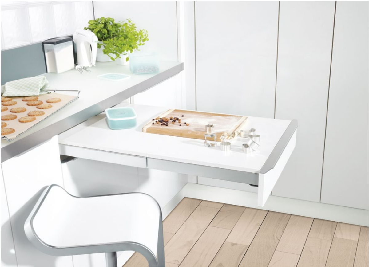
Top Flex : La coulisse de table permettant de travailler assis et d'accroître sa surface utile.