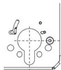
Detail: Variante CHRZ-Lochung