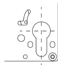
Detail: Variante PZ-Lochung

Die Betätigung des Fallenriegels erfolgt elektrisch oder mit dem Schlüssel über den Wechsel. Die Öffnung der Tür ist grundsätzlich jederzeit in Fluchrichtung möglich.